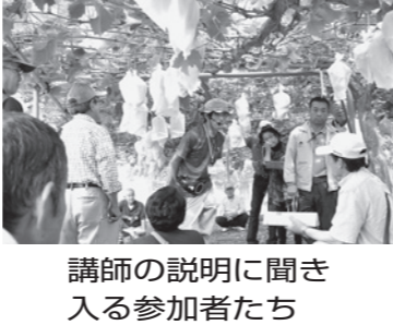
講師の説明に聞き入る参加者たち

(注) 平均価格、キロ単価の小数点以下は四捨五入。「▼」は安値を示す。前回は上場地区ごとの対比。