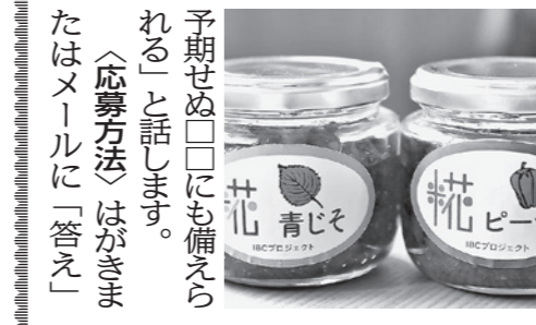
シャインマスカット

研修会では収穫期の延長技術と長期貯蔵技術を紹介。出荷時期の調整で、高収入を目指すものだ。