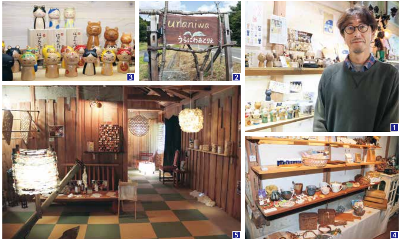
1「気軽に遊びにきてほしい」と阿部さん 2「うらにわあとリエ」の看板が目印 3阿部さんが制作した「にゃんこけし」 4手作りの工芸品で埋め尽くされた店内 5不定期開催のアート作品展