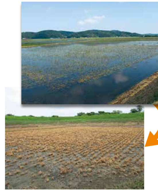
大雨により冠水し、その後水がひいた圃場(水稲)

近年、異常気象により、自然災害が頻発しています。令和元年には台風第19号による被害、令和2年には福島県沖地震、春先の降雪による被害、令和3年には7月の大雨による被害、令和5年には春先の降雪や夏季の高温による被害と、毎年農業経営に影響を及ぼす規模の災害が発生しています。営農計画を策定する時期ですので、いつ発生するかわからない自然災害に対し、日頃より対策を講じるとともに、万が一の備えとして農業共済または収入保険(青色申告の方)への加入をおすすめします。