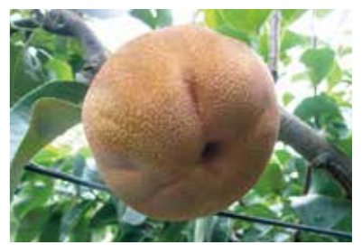
凍霜害により変形した果実(なし)