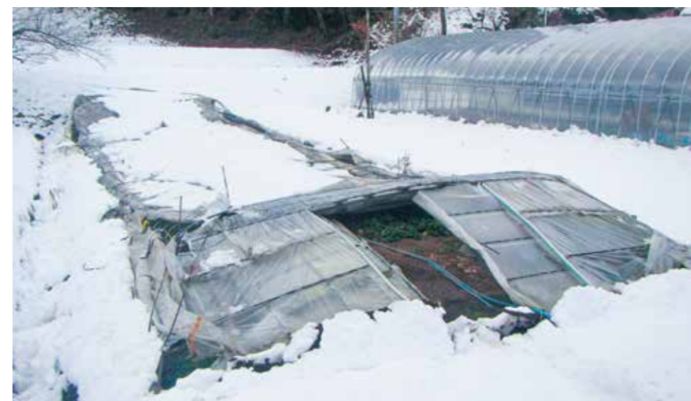
降雪により倒壊したハウス