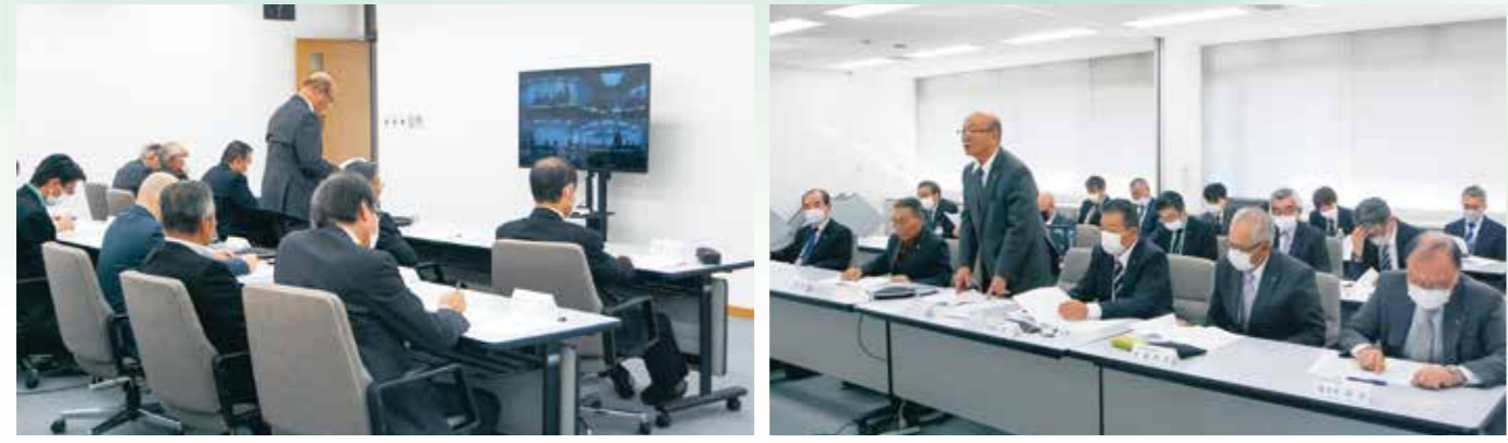
テレビ会議システムにより開催