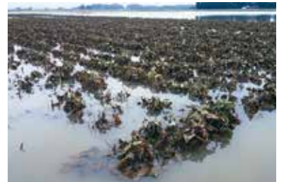
台風により冠水した圃場(大豆)