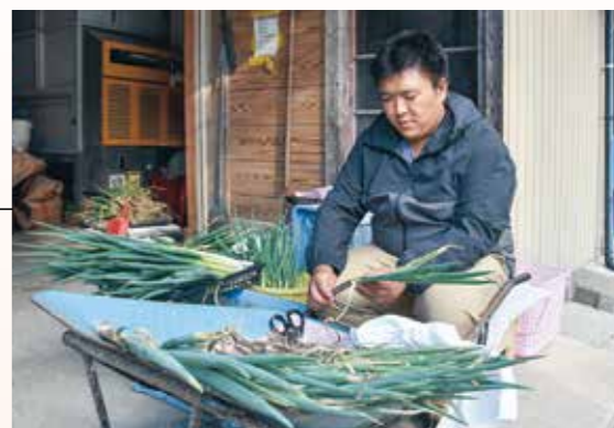
ネギの皮むき作業

小さい頃は農業に興味があったわけではなく、高校も電気系に進学し、将来は電子機械系の仕事をしたいと思っていました。その頃祖父が「農作業が大変になってきたからやめようか」と話しているのを聞き、これまで築いてきたものをやめるのはもったいないと考え、家族の後押しもあり就農しようとして決意しました。高校の薦めで、宮城県農業大学校へ進学し、稲作、ネギの栽培技術を学び、卒業後就農しました。 就農当初は水稻とネギの生産をしていましたが、転作田でネギを栽培したので、稲株の残りがあつたりして土寄せがうまくできないなどネギが細くなかなか良いものが出ませんでした。年を重ねるごとに土質も向上し、年々良いネギが生産できるようになりました。今ではネギをもっと出荷してほしいと依頼もあります。 直売所では、自分の農産物が消費者に喜んでもらえることがやりがいにつながっています。消費者の皆さんにはおいしく食べてもらいたいので、できるだけきれいに整えて出荷することを心掛けています。 昨年からは新たにピーマンの生産も始め、今後はネギの栽培面積を拡大し、品質の高いものを作っていきたいです。