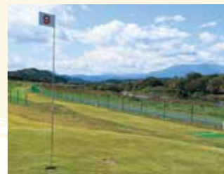
▲梅コース9番ホールからの風景

令和6年3月31日(予定)まで、プレオープン期間(予約制・利用時間は、9時から13時)として、施設利用料・用具貸出料が無料でプレーできます。 パークゴルフは老若男女誰でも楽しめるスポーツです。ご家族や気の合う仲間と一緒にプレーしてみてください。