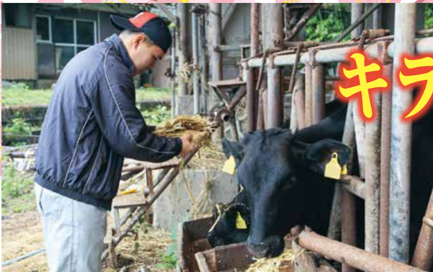
牛の状態を確認しながら餌やりを行う