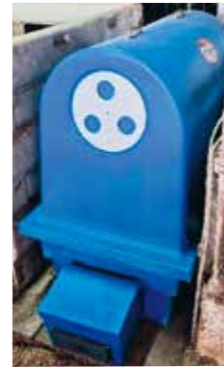
温風で子牛を温めながら乾かすことができる暖房器具

牛のリッキング(なめとり)が重要ですが、なかなかしない母牛も見られます。その際はタオルなどの清拭 せいしき が必要です。 農家さんによっては自宅の玄関にストーブとプール、湯たんぽを用意し、出生直後はプール内で暖を与えている方や、短時間で労力を必要としない方法として保温機 (下記写真) を導入している方もいます。