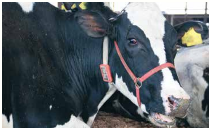
センサーで健康状態を管理