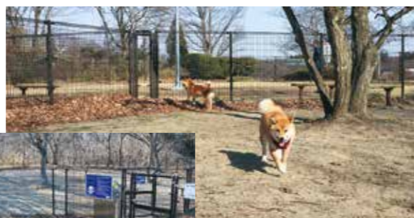
広大なドッグラン