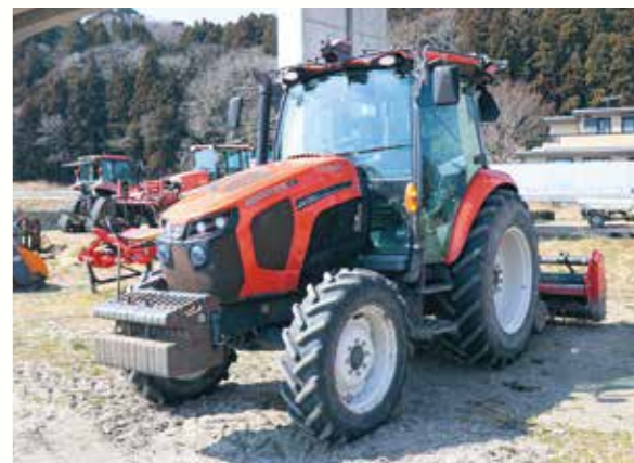
圃場形状を入力することで、自動で生成した最も効率的なルートでの作業ができる

今後は、牧草などの作付面積を増やし飼料の自給率向上にも取り組んでいます。また、敷地内に併設している、OPU(生体内卵子吸引)による体外受精卵を生産するための施設を活用し、遺伝的能力の高い牛の子牛を増産し改良を重ねることで、生産性の更なる向上に力を入れていきたいです。