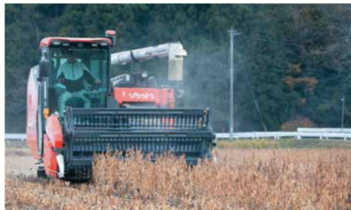
コンバインの刈り取りデータが自動でPCに送信されるため、データを利用した効率的な作業が可能