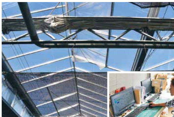
天窓は太陽光を感知して自動開閉