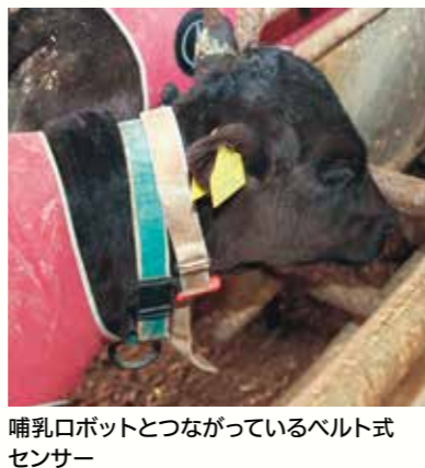
哺乳ロボットとつながっているベルト式センサー