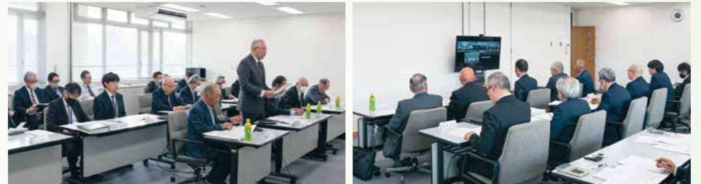
オンラインにより開催