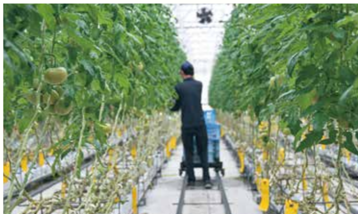
栽培管理システムを使用し生産性の向上につなげている