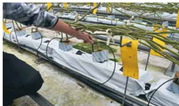
培地には養液を自動的に流している