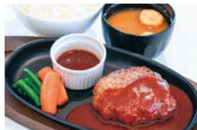
レストランの看板メニュー「仙台牛デミグラスハンバーグ」

「長者原サービスエリア下り」は、古川ICから盛岡方面に向かって車で10分のところにあります。周辺にはラムサール条約湿地に登録された化女沼、敷地内には公園やドッグランを完備した自然豊かなサービスエリアです。スマートICが併設されていることに加え、一般道には12台止められる駐車場が設けられていて、高速道路を利用しなくても入場できるアクセスのよさも魅力の一つです。