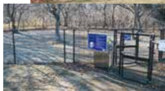
小型犬専用エリアとフリーエリアがあります