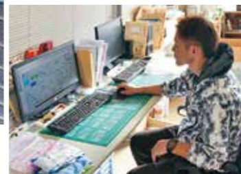
栽培管理システムで生育環境を管理